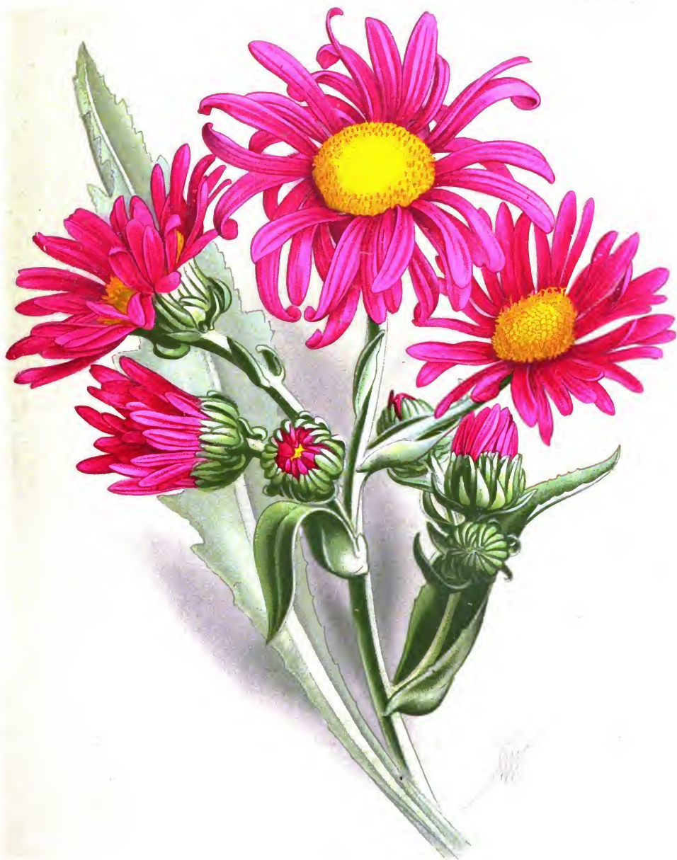
Senecio pulcher Hook et Arn.